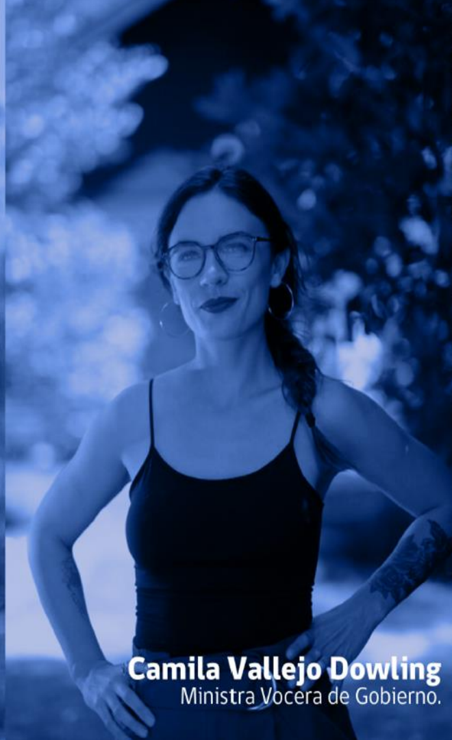
Camila Vallejo Dowling Ministra Vocera de Gobierno.