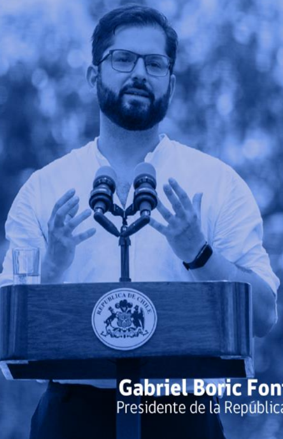
Gabriel Boric Font Presidente de la República.